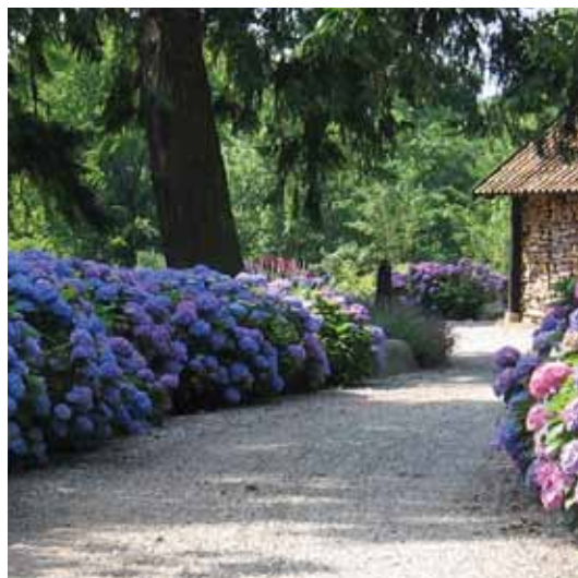
Privat indkørsel, Christiansminde