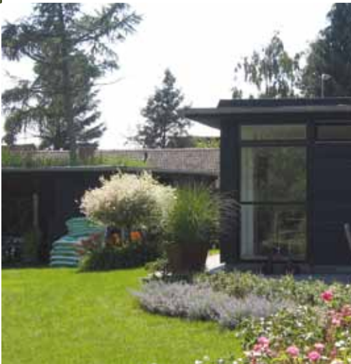
Ældre bevaringsværdige villaer i Svendborg