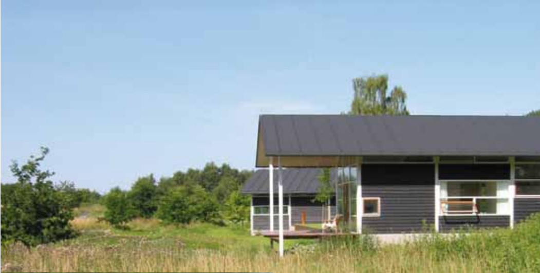
Privat villa, Tåsinge