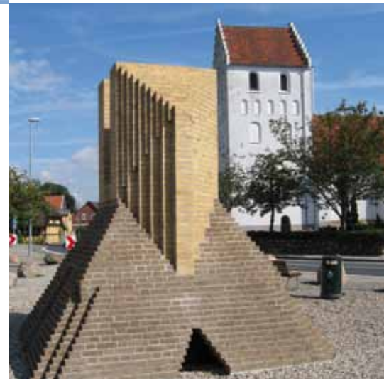
Stenstrup Torv med middelalder kirke