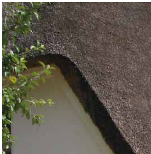
Detalje, bevaringsværdigt hus

Arkitektonisk kvalitet er ikke et statisk begreb, men skal vurderes i forhold til sin tid og sine forudsætninger. Arkitekturpolitikken skal ikke opsætte endegyldige facitlister for den arkitektoniske kvalitet, men inspirere og motivere alle til at tænke sig om. Vi skal vælge kvalitet.