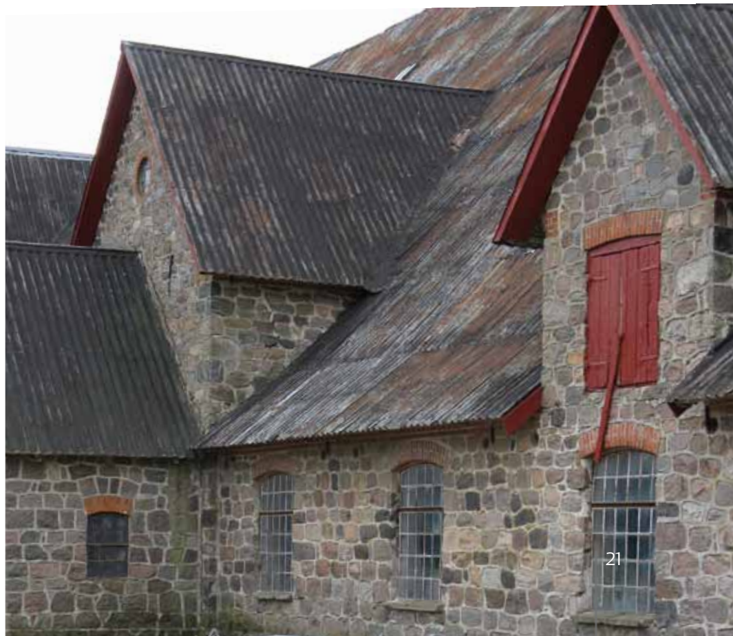
Landbrugsbygning ved Skjoldmose, Stenstrup