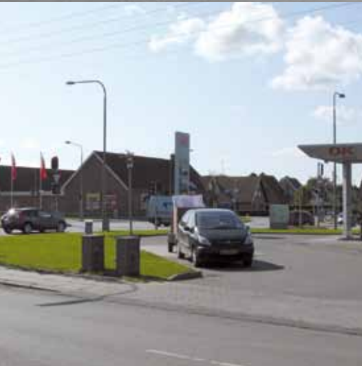
Centerområde ved Sundhøj og Vindebycentret