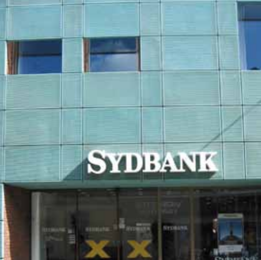
Nænsom skiltning, Brogade