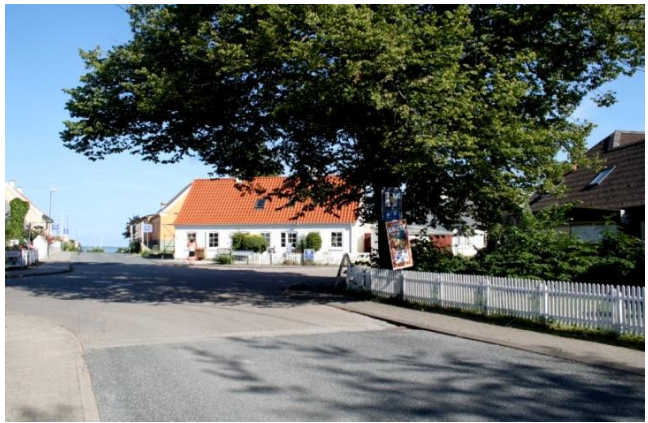
Fra det grønne område ovenfor havnen (tv). Den centrale plads midt i byen (th).