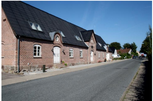
Momleby (tv) og Stiftelsen (th).