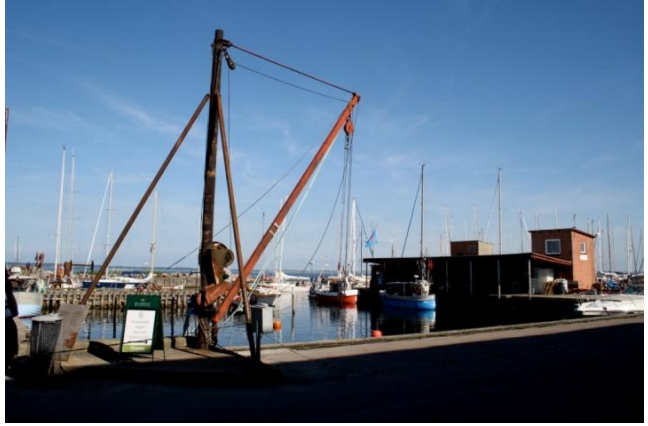
Pakhuset (tv) og fiskesalget (th) er blandt de bygninger, der dominerer havnen.