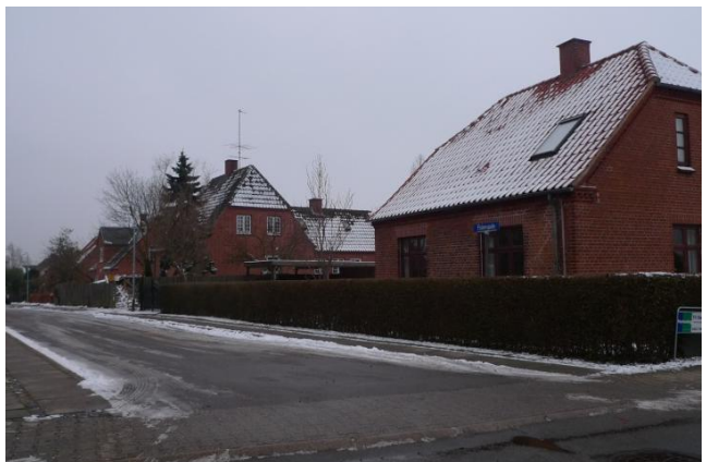
Den ældste bebyggelse på Kystvej, byens hovedgade (tv). Villaer fra 1930'erne på Fiskergade (th).