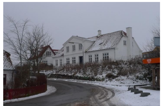
Kro (tv) og manufakturhandel (th).