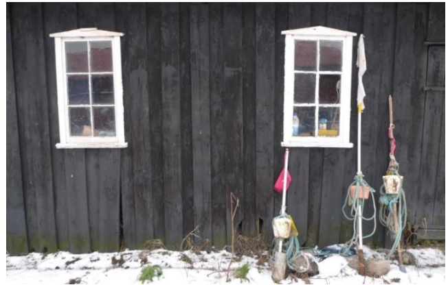
Fiskernes lange grejhus med fine vinduesdetaljer.